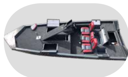
Bass 540 grå