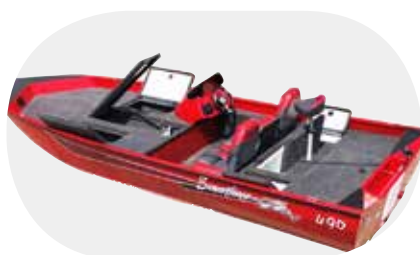
Bass 490 rød